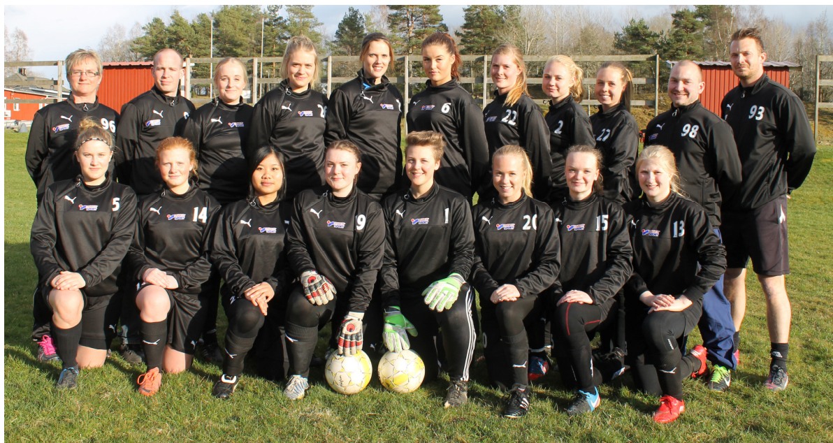
FIK/EFFK/NIF damtrupp 2015.