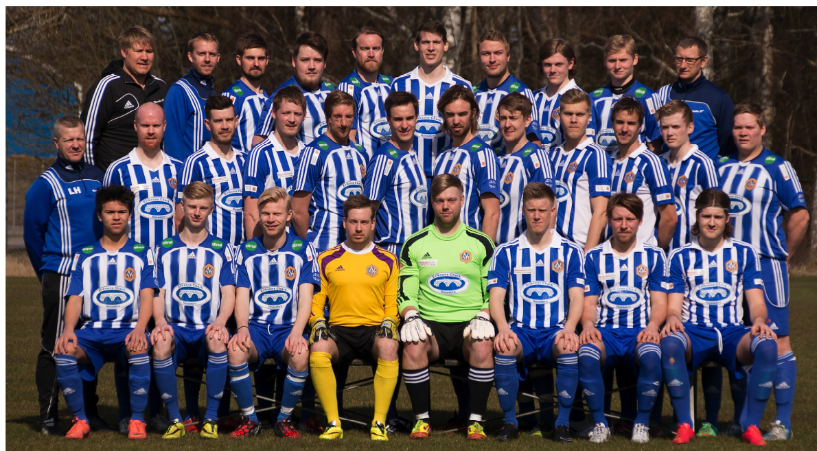
NIF herrtrupp 2015.