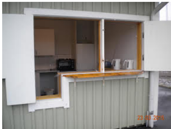
Kioskdelen är handikappanpassad.