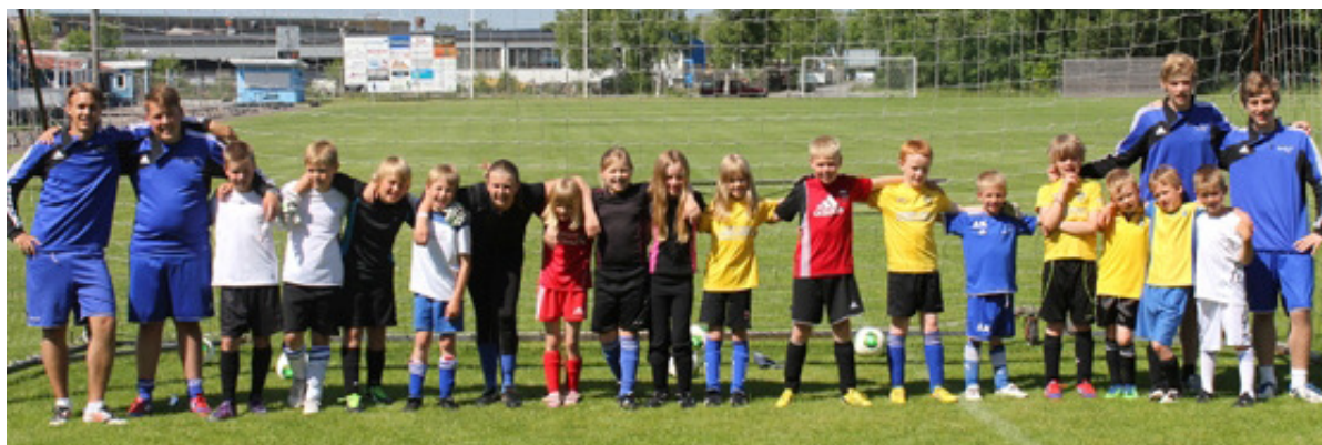
Några spelare och ledare från sommarens fotbollsskola på Brovallen.