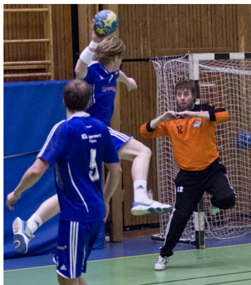
Ny handbollssäsong väntar...

Försäljning av kaffe, kaka, godis och läsk finns under hemmamatcherna!