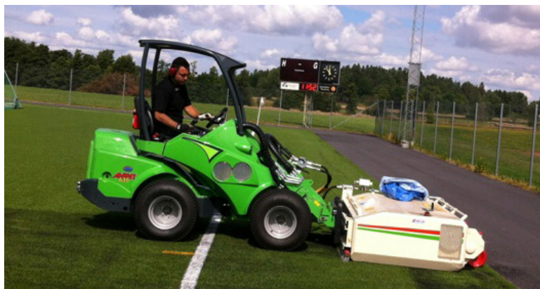
Tvättning av konstgräsplanen i början av augusti.

(Intervjun hämtad från www.sparbanksvallen.se )