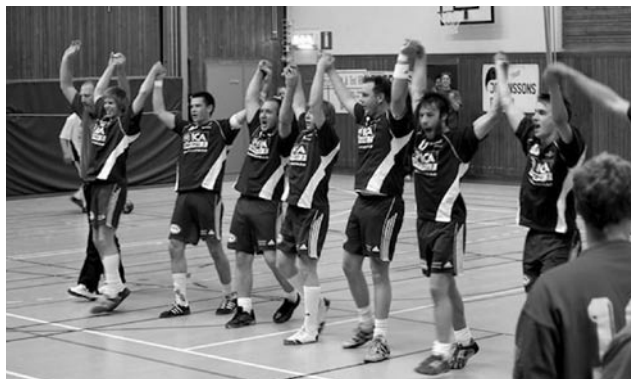
Glada spelare firar serieseger.

Till sist tackar vi vår trogna publik, generösa sponsorer, uppoffrande spelare, tjänstvillig busschaufför, funktionärer, ledare, tränare med flera för era insatser under säsongen.