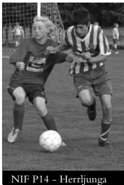
NIF P14 - Herrljunga