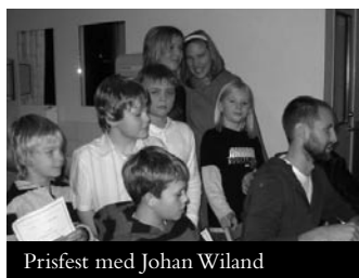
Prisfest med Johan Wiland