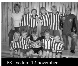
P8 i Vedum 12 november