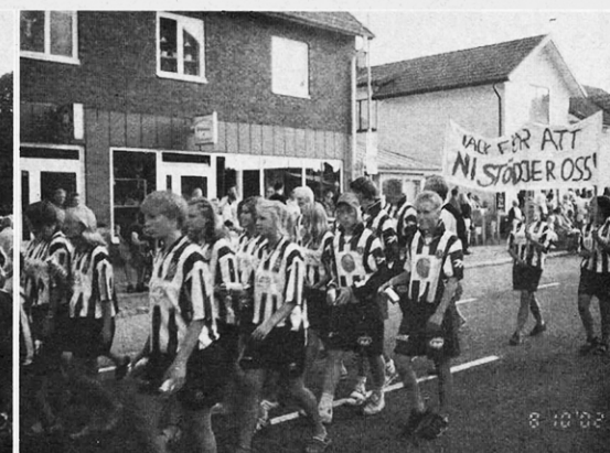
Stort följ i tåget med både ungdoms och seniorlag.

Lördagen den 10 augusti var det den stora jubileumsdagen för Essunga kommun.