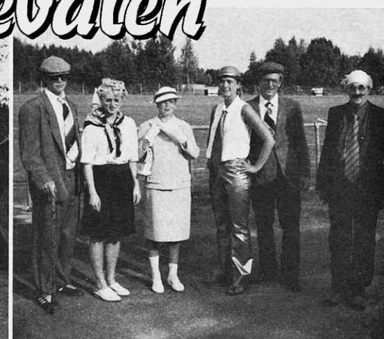
"Laket" och "Miljonmannen" med inbjudna gäster