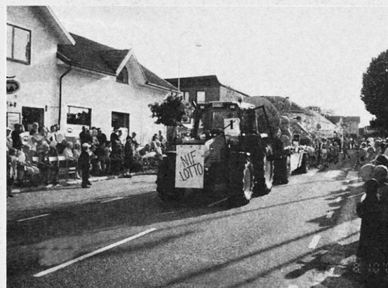
Passande nummerlapp på traktorn som drog NIF-vagnen