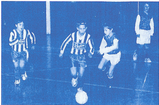
Finalen mellan Nossebro vit och Trollhättan höjdes på mycken dramatik. Trollhättan reducerade NIF:s ledning men Nossebro kom igen och vann i sudden death.